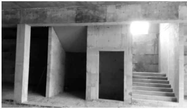
Рис. 3. Приклад використання монолітного пінобетону в якості внутрішніх стін торговельного комплексу в м. Кропивницький