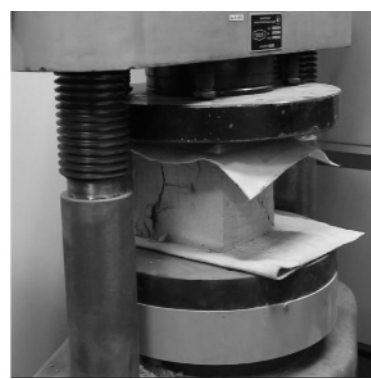
Рис. 2. Вигляд дослідного зразка після випробування