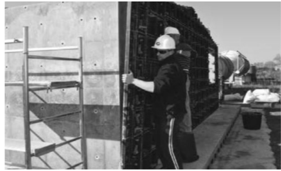
Рис. 4. Використання опалубки GeoPlast для укладання монолітного пінобетону при улаштуванні огорожувальних конструкцій житлової будівлі в м. Знамянка

тично не потребує вирівнювання перед оздобленням. Невелика вага панелей (максимум 11 кг) забезпечує високу швидкість переміщення й монтажу опалубки для бетонування стін, колон, перекриттів та інших конструкцій навіть силами одного робітника. Приклади монтажу опалубки GeoPlast для бетонування різних конструкцій наведені на рисунку 5.