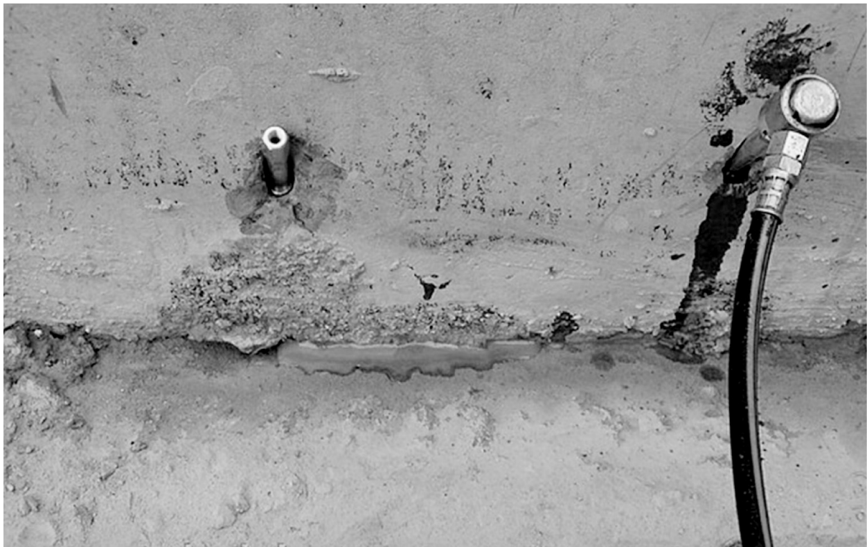
Рис. 3. Ін'єкційна гідроізоляція швів з матеріалу Мінова (Німеччина)

Для влаштування гідроізоляції тунелів відкритого і закритого способу робіт компанія "AGRU Kunststofftechnik GmbH" (Німеччина) застосовує мембрану AGRUflex в поєднанні з геотекстилем. Довговічність такої гідроізоляції, за даними німець-