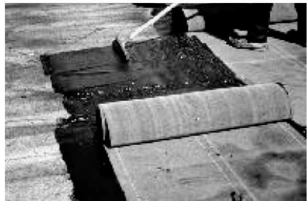
Рис. 1. Влаштування прогумованої мембрани MM6125 на гарячий асфальтовий шар

Лондонська гідроізоляційна компанія LONDON WATERPROOFING (Великобританія) більше 25 років займається захистом від вологи і гідроізоляцією об'єктів в Лондоні. Гідроізоляційні мембрани виготовлені з поліетилену високої щільності або по-