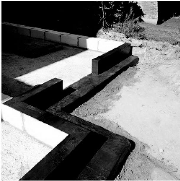
Рис. 7. Високоєфективна стрічка Полістоп. Внутрішній і зовнішній ПВХ-водяний стопор для швів фірми Henkel