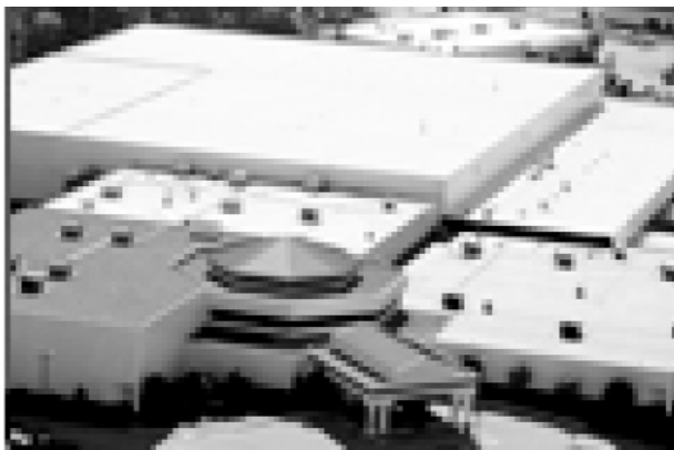
Рис. 5. Влаштування гідроізоляції з EPDM-мембрани (з пригрузом)

Фірма MINOVA поставляє широкий асортимент