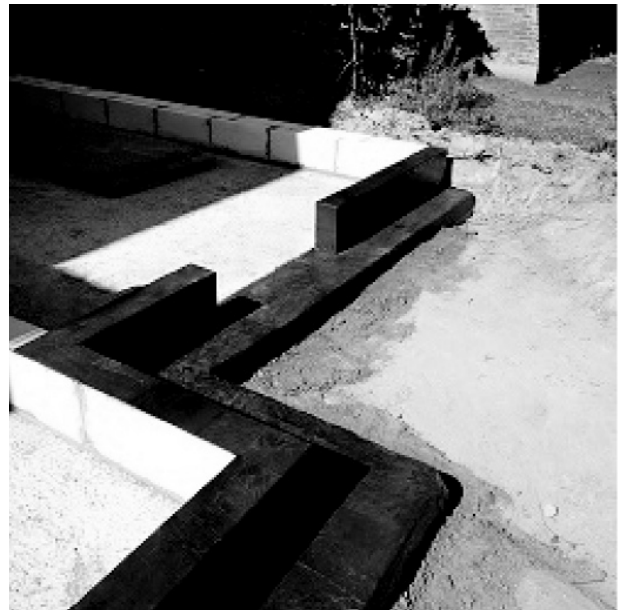
Рис. 6. Гідроізоляція з високоефективною гнучкої еластомірної бітумної мембрани SBS з нетканним поліефірним армуванням фірми Soprema UK

Із сучасних видів гідроізоляційних систем на основі полімерних мембран фірми MINOVA для під-