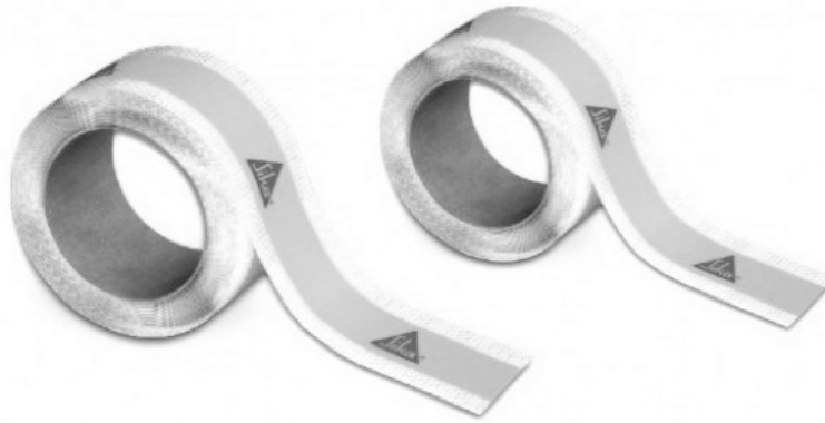
Рис. 2. Полімер-каучукова герметизуюча стрічка для герметизації примикань і швів у вологих зонах

ліпропілену. Вони виготовляються у формі листа з широким діапазоном ширини і товщини, призначеним для запобігання проникнення вологи всередину конструкції. Дренажні мембрани порожнин мають шпильки різних розмірів, які дозволяють воді стекти під дією сили тяжіння до найнижчої точки. Мембрани є гнучкими і здатні протистояти розтріскуванню і переміщенню всередині конструкції.