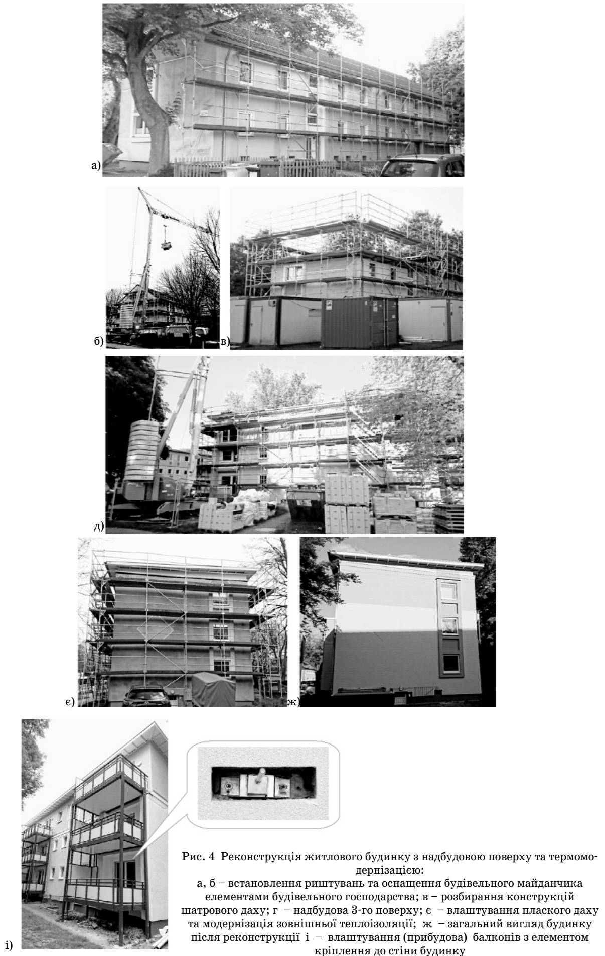
Рис. 4 Реконструкція житлового будинку з надбудовою поверху та термо-дернізацією:

а, б – встановлення риштувань та оснащення будівельного майданчика елементами будівельного господарства; в – розбирання конструкцій шатрового даху; г – надбудова 3-го поверху; е – влаштування плоского даху та модернізація зовнішньої теплоізоляції; ж – загальний вигляд будинку після реконструкції і – влаштування (прибудова) балконів з елементом кріплення до стіни будинку