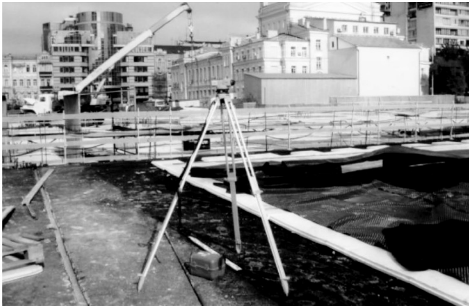
Рис. 3. Встановлення нівеліра на виконаній гідроізоляції

споруди, погіршення умов праці та зменшення прибутку від його експлуатації. Збільшуються прямі витрати на проведення поточних і капітальних ремонтів.