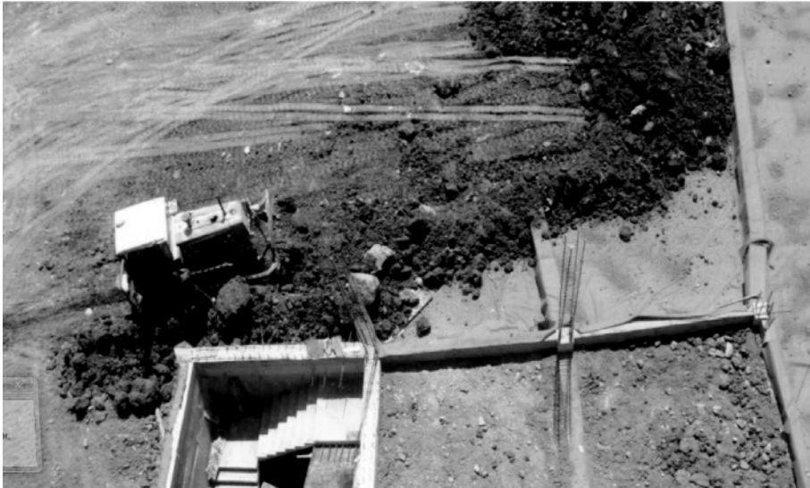
Рис. 1. Зворотна засипка виконаної гідроізоляції ґрунтом з включенням каменів

ваності виконання (необхідно назустріч подачі гідроізоляційних матеріалів).